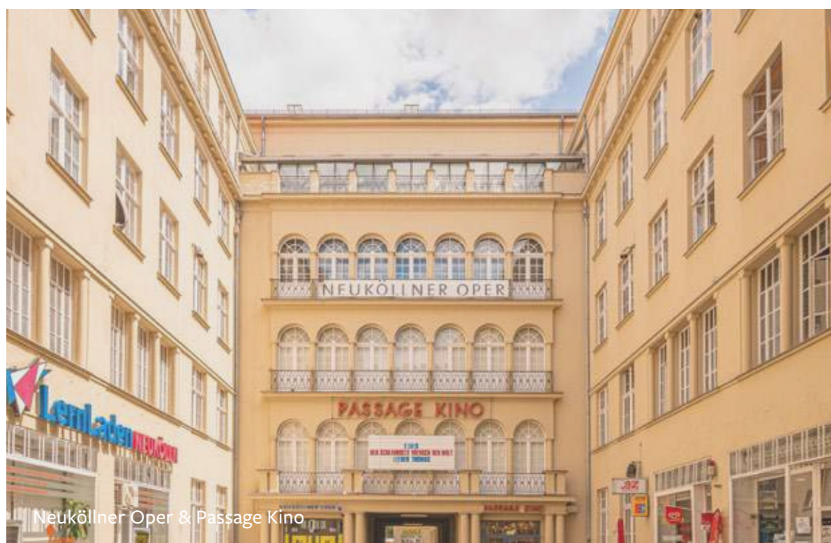
Neuköllner Oper & Passage Kino

Die Fuldastraße ist beliebt und belebt, liegt direkt im Herzen des Bezirks und damit unweit von Weigandufer sowie des Volksparks Hasenheide. Auch der historische Richardplatz in Rixdorf ist von hier aus fußläufig erreichbar. Hermannplatz und Karl-Marx-Straße bieten die perfekte Anbindung an den öffentlichen Verkehr und zahlreiche Einkaufsmöglichkeiten.