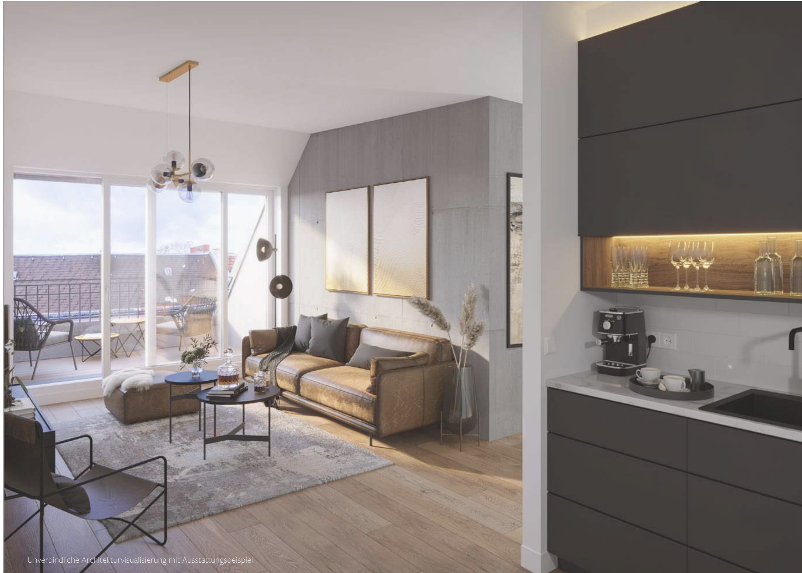
Unverbindliche Architekturvisualisierung mit Ausstattungsbeispiel