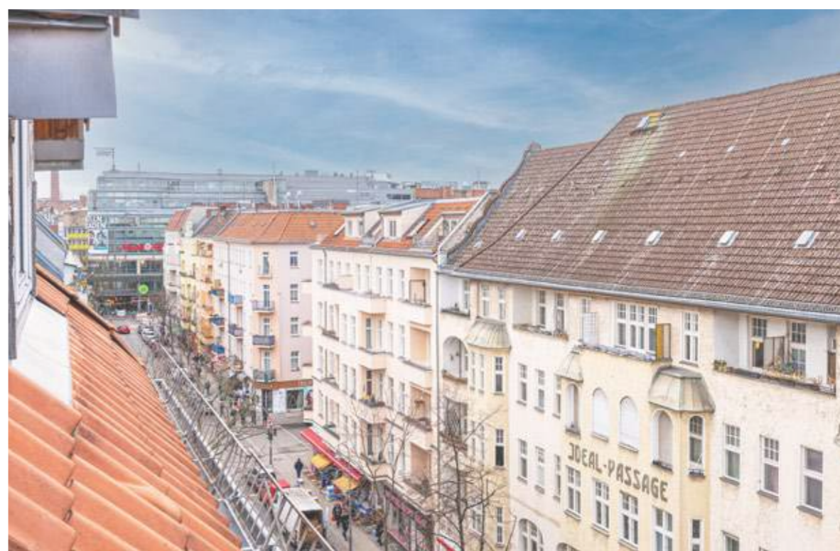
Welcome to Berlin-Neukölln

Turbulentes Kiezgefühl zwischen multikulturellem Altberliner Charme und kreativer Bohème, Lebendigkeit und avantgardistische Trends am Puls der Zeit: Das ist Neukölln zwischen Reuter-, Donau- und Weserkiez. Hier findet sich der schlichte Altbau in der Fuldastraße 9, welcher Mieter:innen wie auch Eigentümer:innen ein ruhiges Zuhause in einer aufregenden und dynamischen Umgebung schafft.